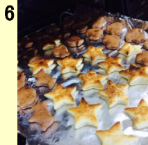
6 3分で、こんなに焦げ目が 箸でひっくり返し、後2分 出来上がりです。