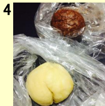
4 耳たぶ位の硬さに なるように、少し ずつ牛乳を投入