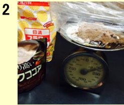
2 牛乳以外の材料 小麦粉、ココア、油 を袋に入れます。 甘めがいい方は 20g砂糖追加します