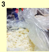
3 少しダマになるよう に振る。